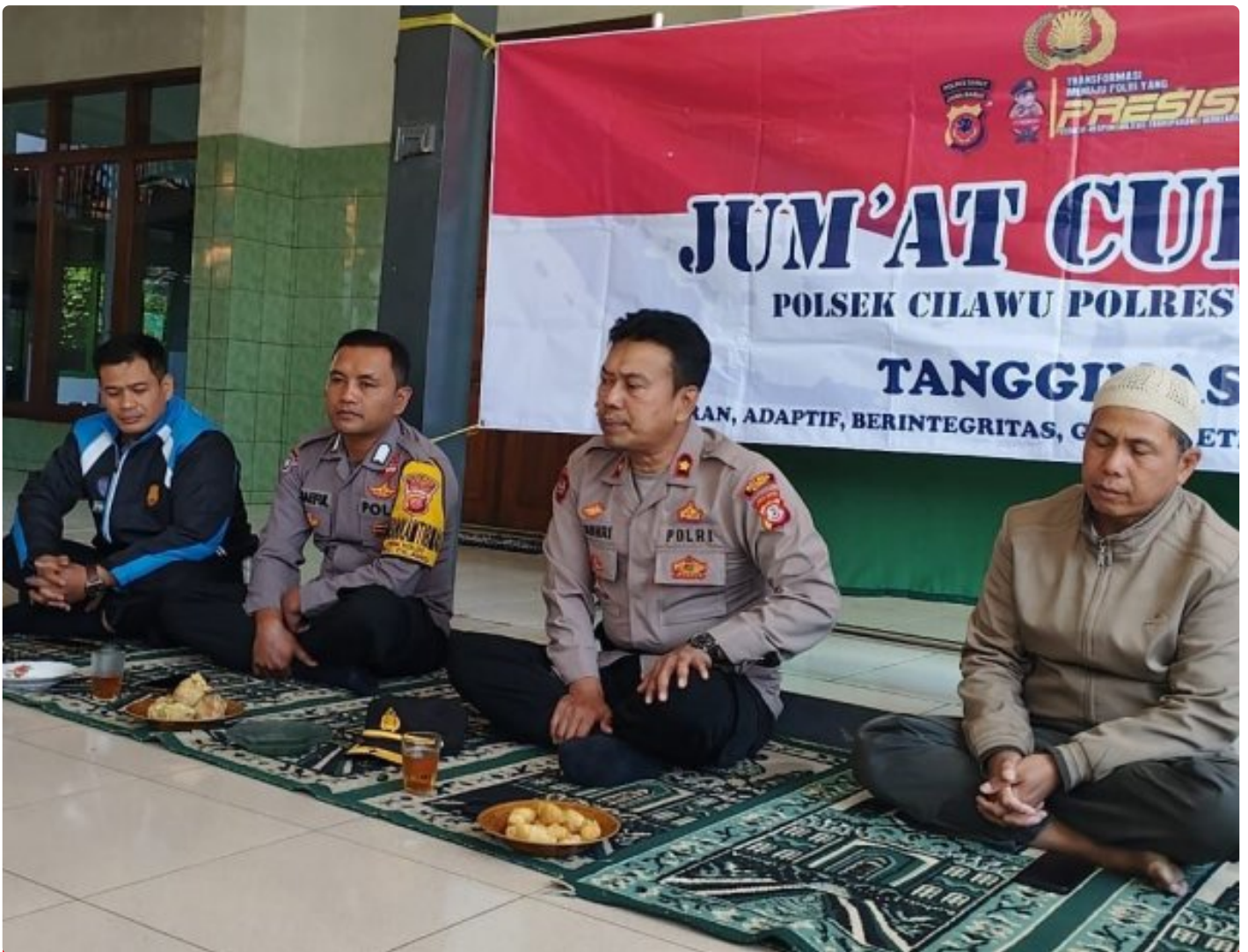
Kapolsek Cilawu mendengarkan curhatan warga